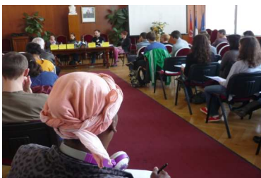
Info-rencontre organisée dans le cadre de la Semaine d'Information pour la Santé Mentale