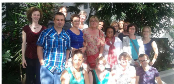
Délégation des CLSM de Lyon 8 ème et 3 ème lors des Journées Nationales des CLSM à Nantes - Septembre 2014