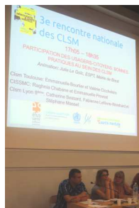
Trois membres du CLSM de Lyon 8 ème intervenant à la table ronde « Implication des usagers » durant la Journée Nationale des CLSM - Nantes - Septembre 2014