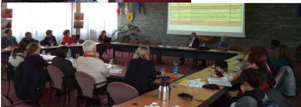
Rencontre du CLSM de Lille-Est—Décembre 2013